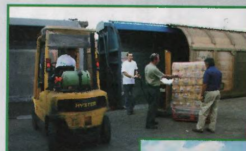
Le transporteur Districhrono (Compiègne, Rungis, Avignon, Montauban) bénéficie à présent de la messagerie Exchange.